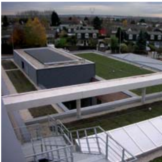
Collège Demailly (Frankrijk)

Onmiddellijk na de plaatsing van de beschermlaag wordt de RENOLIT ALKORPLAN L 35177 dakbaan uitgerold en spanningsvrij gericht met een overlapping van 50 mm. Om dit te vereenvoudigen werd op de dakbaan een merkstreep aangebracht. De overlappingsen worden thermisch gelast over een breedte van minimum 30 mm. De verbindingen dienen te gebeuren zoals beschreven in de CTG of ATG van de dakbaan. Als meer dan 2 banen elkaar overlappen, dient de kant van de middenste baan afgeschuind te worden. Dit kan gebeuren d.m.v. het thermisch lasapparaat. Dwarsoverlappingsen dienen ten opzichte van elkaar te verspringen om kruisoverlappingsen te vermijden. Alle naden dienen op waterdichtheid gecontroleerd te worden. Voor de afwerking van de lasnaad bij omkeerdaken dient vloeibare RENOLIT ALKORPLAN 81038 gebruikt te worden. De RENOLIT ALKORPLAN dakbaan moet bij elke dakdoorbreking in de rand bevestigd worden. De uittrekkraft is > 2700 N/m.