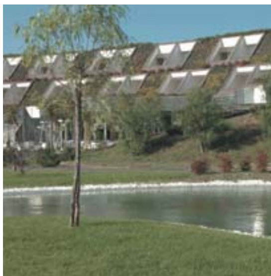
Hotel Kalidria (Italië)