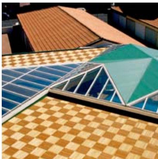
Restaurant Deleuil (Frankrijk)

Elke levering kan tot 10% korte rollen bevatten (min. rollengte 8m).