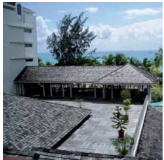
Hotel Créole Beach (Guadeloupe)